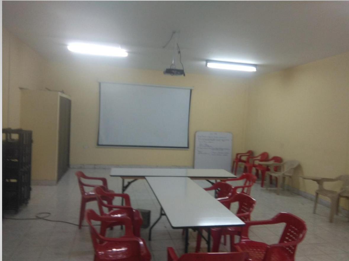
Salon de Audio